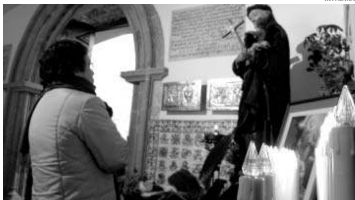
A Igreja Católica é contra a utilização de embriões humanos excedentários

Em Portugal vigora com força de lei, desde Dezembro de 2001, a Convenção Europeia para a Protecção dos Direitos Humanos e Dignidade do Ser Humano, no que respeita à Aplicação da Biologia e Medicina (igualmente denominada Convenção de Oviedo). O artigo 18 da Convenção de Oviedo proíbe a "criação de embriões hu-